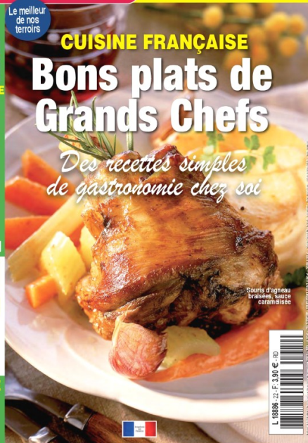
Serron d'agneau braisé, sauce caramélisée

DÉLICE DU DAUPHINÉ Gâteau de Savoie riz soufflé et chocolat